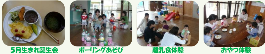
5月生まれ誕生会 ポーリングあそび 離乳食体験 おやつ体験