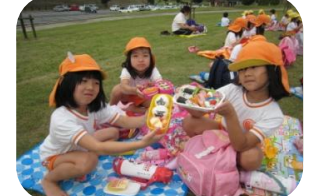
～高崎総合公園～ ぞう組 きりん組