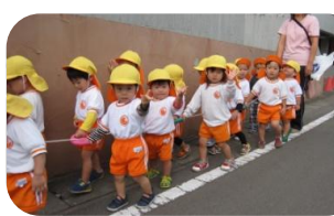
～園内遠足～ ひよこ組 小りす組