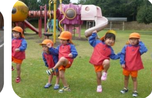
～十三塚運動公園～ 大りす組 うさぎ組