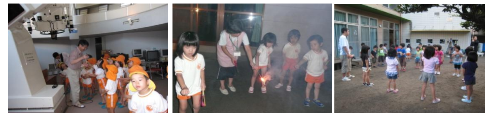
～一泊保育の思い出(5歳児)～