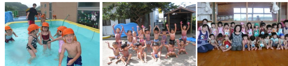
～ プールあそび ・ ボディペインティング ・ プールじまい ～