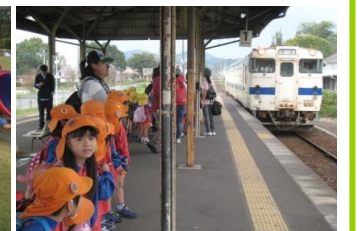
~高崎総合公園~ ぞう組 きりん組