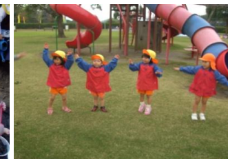
~十三塚運動公園~ 大りす組 うさぎ組