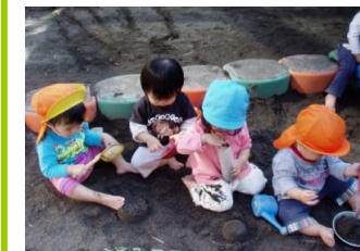
~園内遠足~ ひよこ組 小りす組

10月25日(火)に、秋の遠足がありました。ぞう・きりん組は高崎総合公園に行ってきました。ぞう・きりん組は列車に乗り、少し興奮し、とても楽しそうでした。大りす・うさぎ組は、十三塚公園に行き、いろんな遊具でたくさん遊びました。こりす・ひよこ組は園内遠足でした。園の近くを散歩したり楽しく過ごしました。子どもたちは手作りのお弁当をとてよるこんで食べていました。朝早くから作られたと思いますが、ありがとうございました。