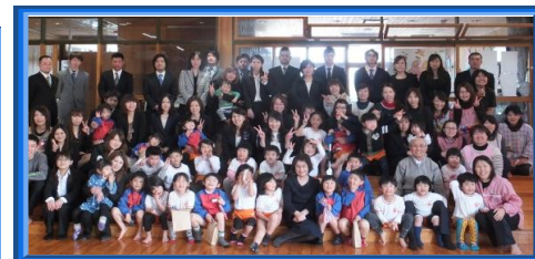
第40回卒園式と茶話会