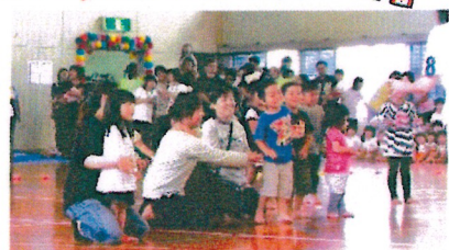
かけっこもがんばってアンパンマンのハンドソープのお土産をもらいました～☆