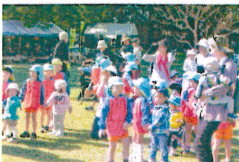
保育園のお友達 とゲームをしま した。オレンジ 色のコスモスが とってもきれい でした。