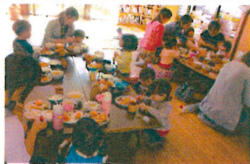
保育園でおい しい給食を食 べました。