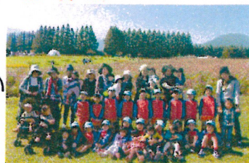
きりん組さん と仲良しにな りました！