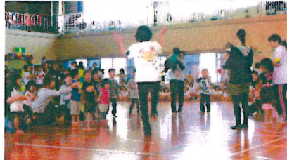
みんなで「大きなくりの木の下で～」を踊りました♪