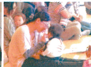
わらべうたを親子 でしました。ママ のおひざでチョン チョンキューツ!!