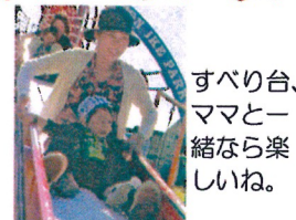
すべり台、 ママと一 緒なら楽 しいね。