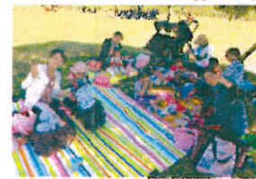
お弁当の時間、一番楽しみね。