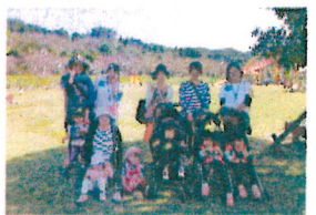
大・大満足で楽しい遠足でした! ごろごろ上手に転がるかな～