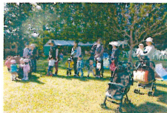
今日は よろしくお願 いします～！