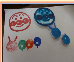
説明だけだと難しいかも？！